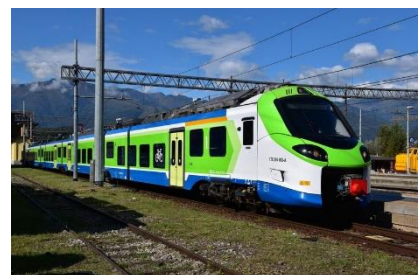
Nieuwe trein in Italië met lage instap

In alle regionale treinen kan de fiets mee. Reserveren kan niet. Je hebt wel een fietskaartje nodig. "Er rijden ook nog oude treinen met een lastige instap. De fietsplekken zijn of helemaal aan de voorkant of de achterkant van de trein. Niemand weet waar dit voor de aankomende trein is. Kies dus positie in het midden. Let op de binnenkomende trein".